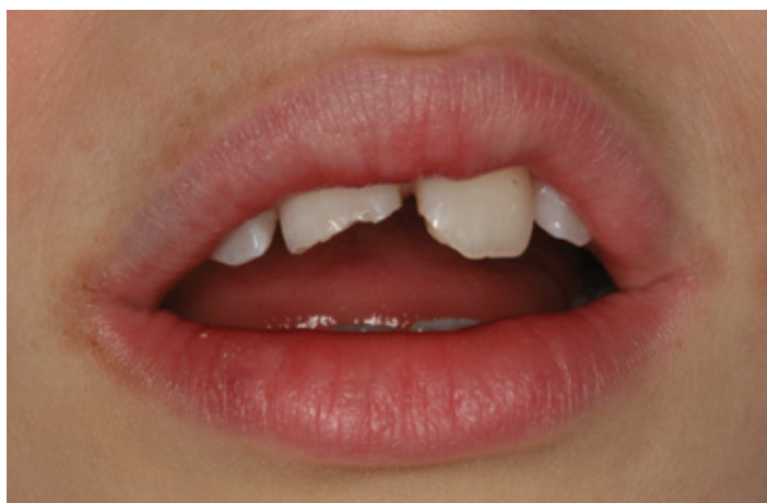
Nieszczęśliwy wypadek. Podczas zabawy na sankach 8-letni chłopczyk złamał sobie obie jedyńki.