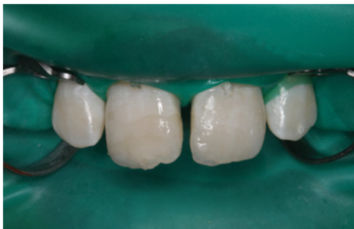
Zostały one przyklejone w gabinecie stomatologicznym.