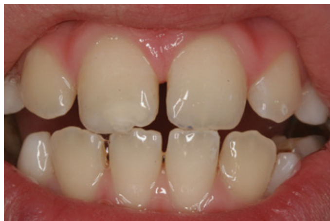
Efekt końcowy po przyklejeniu obu fragmentów.